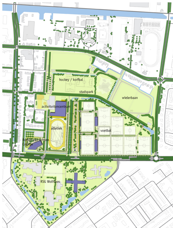
Figuur 1. Het Bentinckspark, met in het midden het Activum/Activiteitscentrum.

Op 22 januari 2009 stelde de raad van Hoogeveen het Stedebouwkundig Programma van Eisen voor het Bentinckspark vast. Met dit plan koos de raad voor een kwaliteitsniveau op regionale schaal. De ambitie van de raad lag daarmee hoger dan het creëren van een lokale voorziening; het moest een topsportaccommodatie worden.