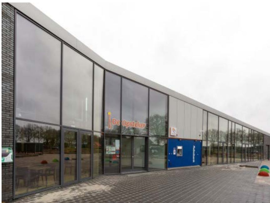
Figuur 3. MFC Nieuwlande, "De Opsteker" (bron: Krant van Hoogeveen, Gerrit Boer).

De gemeenteraad is betrokken geweest bij de kaderstellende afspraken rond het MFC Nieuwlande, onder meer over het bouwbudget van ruim €5 mln.. De raad heeft in de periode 2010 tot de opening in 2014 geen besluiten genomen over MFC Nieuwlande. De besluitvorming rond ontwerp en de inrichting van het beheer van MFC Nieuwlande is door het college van B&W gedaan.