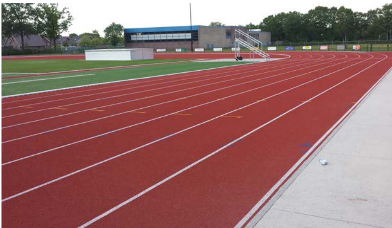
Figuur 2. De beoogde locatie van het Activum, naast de nieuwe atletiekbaan van HAC '63.

Het ideaalplaatje voor de gemeente was de gezamenlijke horeca-exploitatie door 33 verenigingen zoals bij de Universiteit Twente. De gemeente wilde de Hoogeveense verenigingen prikkelen om in het Activum een dergelijke samenwerking op te tuigen en vanuit een gezamenlijke entiteit de horeca-exploitatie te doen. Atletiekvereniging HAC '63 (HAC) en volleybalvereniging Olhaco waren met name in beeld omdat het plan was dat beide verenigingen zouden verplaatsen naar het Bentinckspark. HAC omdat zij daar een nieuwe atletiekbaan zouden krijgen en Olhaco omdat zij zouden verplaatsen van hun huidige hoofdlocatie Trasselt naar de topsporthal in het Activum.