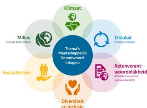
Figuur 2. Zes thema's voor Maatschappelijk Verantwoord Inkopen.

Social return is een instrument dat door overheden kan worden ingezet bij inkopen om de arbeidsparticipatie van mensen met een afstand tot de arbeidsmarkt te stimuleren. Social return maakt onderdeel uit van een van de zes (landelijke) thema's voor Maatschappelijk Verantwoord Inkopen (zie figuur 2). Cijfers van 2019 laten zien dat social return in 71% van de (gemeten) inkopen wordt meegenomen. 6